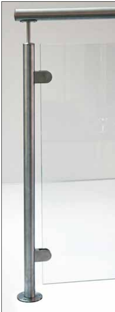
Runda stolpar och klämfästen.