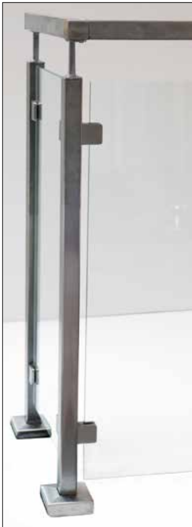
Fyrkantiga stolpar och klämfästen.